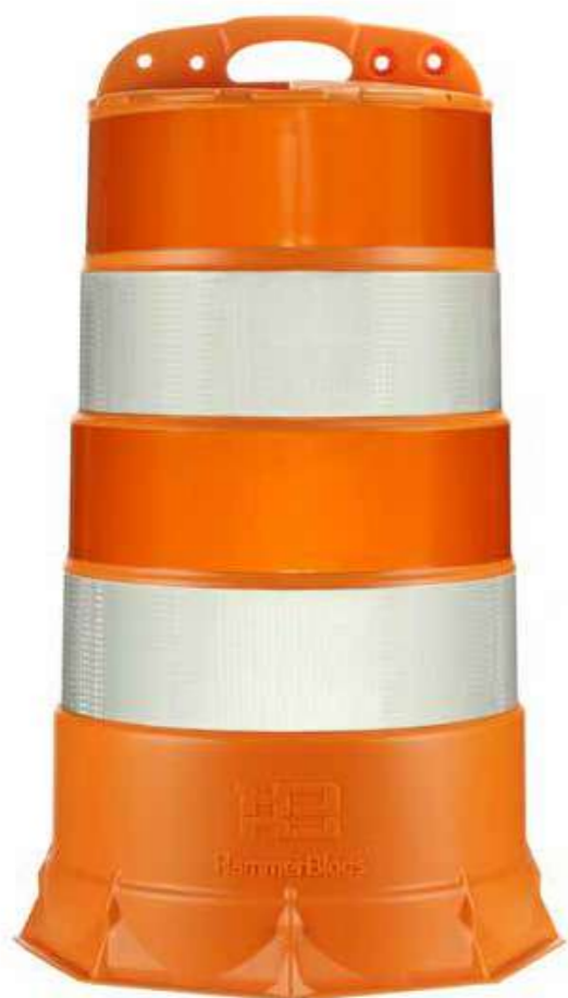
Peso del cilindro: 5.3kg aprox.