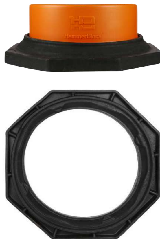
Peso del lastre: 6kg aprox.